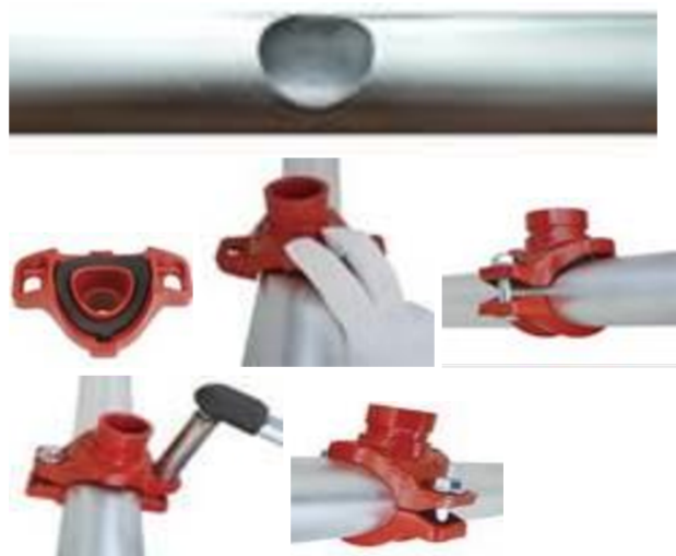
Рис.3. Установка отвода (седелка) под муфту на трубопровод.

6) Убедитесь, что зазор между верхней и нижней частями ровный и минимальный