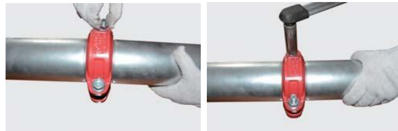
Рис.3. Грувлочное соединение гибкой муфтой.